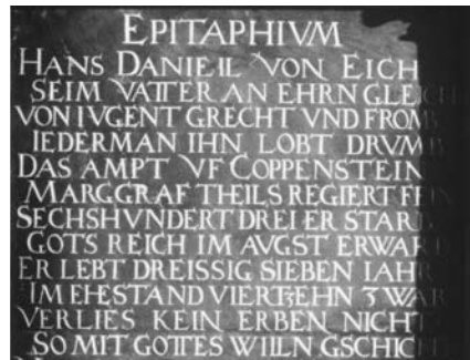
Epitaph des Daniel von Eich (Nr. 7)

in der Renaissancekapitalis wieder aufgegriffen. Diese jüngeren Kapitalisschriften des 15. bis 17. Jahrhunderts weisen nur in seltenen Fällen die strengen Konstruktionsprinzipien der antiken Kapitalis auf. Sie kommen in vielfältigen Erscheinungsformen vor, z.B. mit schmalen hohen Buchstaben oder als schrägliegende Schriften.